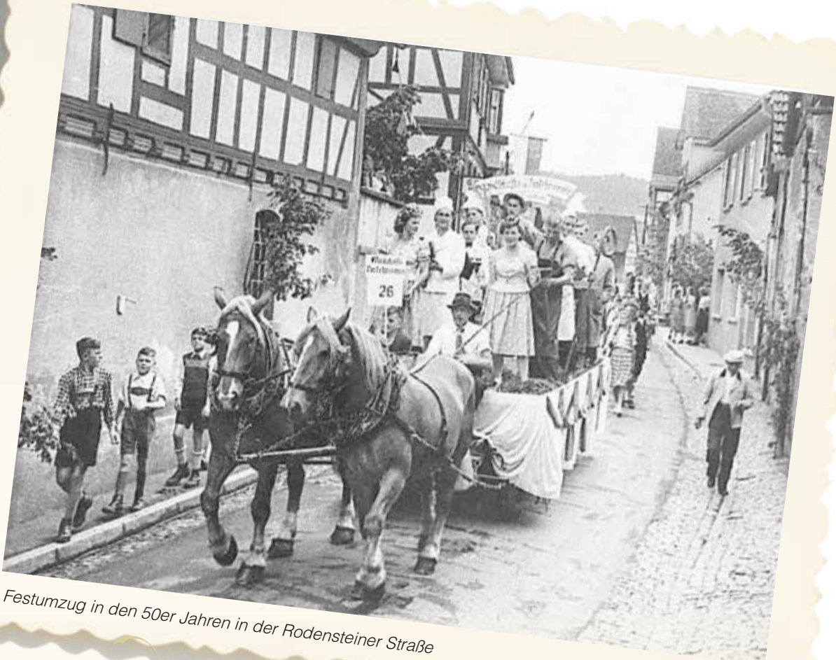
Festumzug in den 50er Jahren in der Rodensteiner Straße