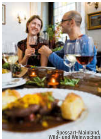
Spessart-Mainland, Wild- und Weinwochen