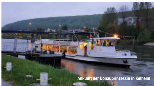
Ankunft der Donauprinzessin in Kelheim