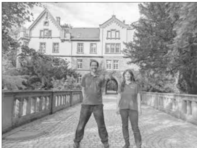
Das Bild zeigt die beiden D2 Absolventen vor dem Schloss in Großen-Buseck.

Das „Silberne Musikabzeichen“ geht gleich doppelt nach Fränkisch-Crumbach.