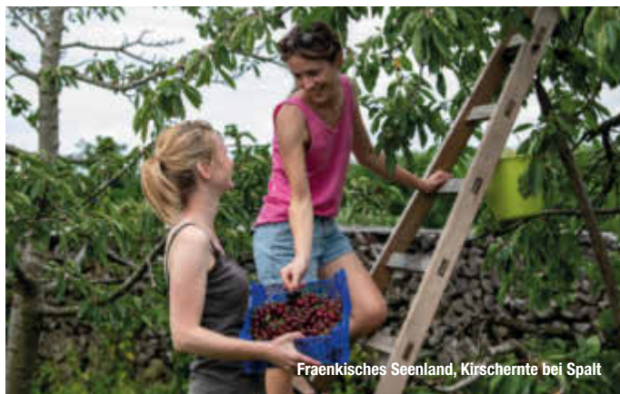
Fraenkisches Seenland, Kirschernte bei Spalt