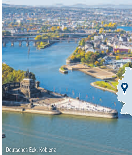
Deutsches Eck, Koblenz

Preise ggf. zzgl. Terminzuschlag. Einzelzimmerzuschlag: 16 €/Nacht Bettensteuer: ca. 1 € pro Person/Nacht