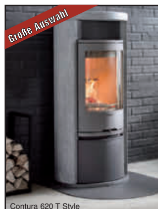
Contura 620 T Style

BCD Containerdienst GmbH & Co. KG Zeller Gewerbezentrum 27 | 64732 Bad König/Zell | Tel.: 0 60 63 - 91 35 47 www.bcdcontainerdienst.de | info@bcdcontainerdienst.de