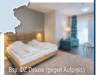
Bsp. DZ Deluxe (gegen Aufpreis)