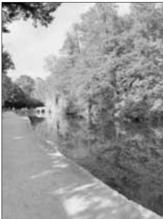
Ein Teil des Park Schöntal, mitten in Aschaffenburg.

Er dankt den Mitreisenden und ist sich sicher, dass es für alle ein schöner und erlebnisreicher Tag war.