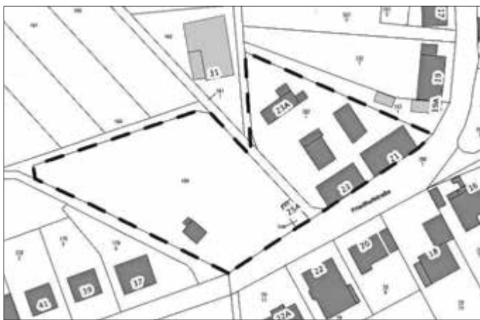
Abbildung 1: Abbildung: Geltungsbereich Bebauungsplan „Obere Friedhofstraße“, unmaßstäblich

Die Gemeindevertretung der Gemeinde Fränkisch Crumbach hat in ihrer Sitzung am 03.05.2024 beschlossen den Entwurf des Bebauungsplanes für das Gebiet „Obere Friedhofstraße“ gemäß § 3 Abs. 1 BauGB für die Dauer eines Monats öffentlich auszulegen. Die Abgrenzung des Geltungsbereichs ist der nachfolgenden Übersichtskarte zu entnehmen. Der räumliche Geltungsbereich umfasst in der Flur 32 die Flurstücke 157/1, 158, 159, 161/1 und 165 sowie den Geltungsbereich des rechtskräftigen Bebauungsplans „Friedhofstraße“ vom 29.05.2006 (Flur 32, Flurstück 170).