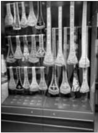
Die Paramentenkammer mit Gewändern und Scherben aus dem ehemaligen Domschatz. Sie dürfen nicht bewegt werden, ansonsten zerbröseln der Stoff zu Staub!