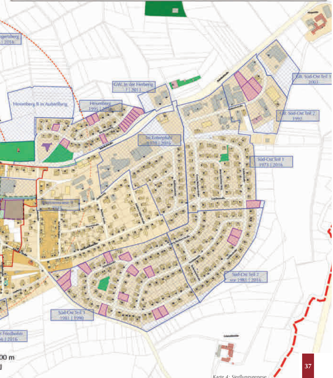
Karte 4: Siedlungsgenese