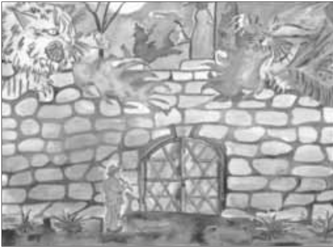
Aquarell von Carmen Berger, Fränkisch-Crumbach