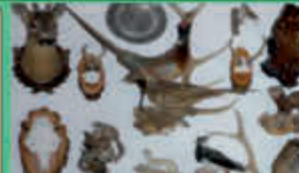
Wir kaufen: Tierpräparate, Trophäen, Gewebe aus Nachlass, Sammlungsanfertigungen!