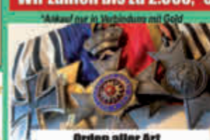
Orden aller Art

Wir beraten Sie gerne unverbindlich und kostenlos, auch vor Ort!