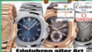
Edeluhren aller Art