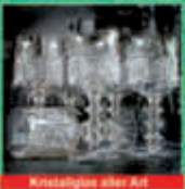
Kristallglas aller Art