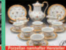
Porzellan namhafter Hersteller