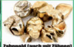
Zahngold (auch mit Zähnen)