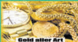
Gold aller Art