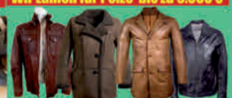
Ankauf von Lederjacketen, Ledermäntel und Lederhosen aus Glatt- und Wildleder, auch Lammfellmäntel