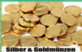
Silber & Goldmünzen