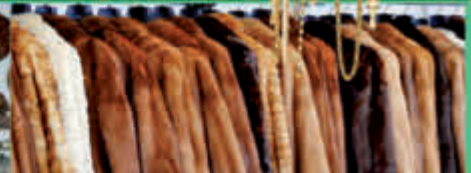
Bisam • Porsianer • Fuchspelze aller Art • Zobel • Nerz • Nutria • Chincilla

Wir beraten Sie gerne unverbindlich und kostenlos, auch vor Ort!