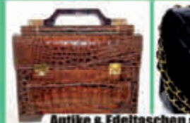
Antike & Edeltaschen aller Art