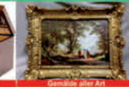
Gemälde aller Art