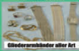
Gllederarmbänder aller Art