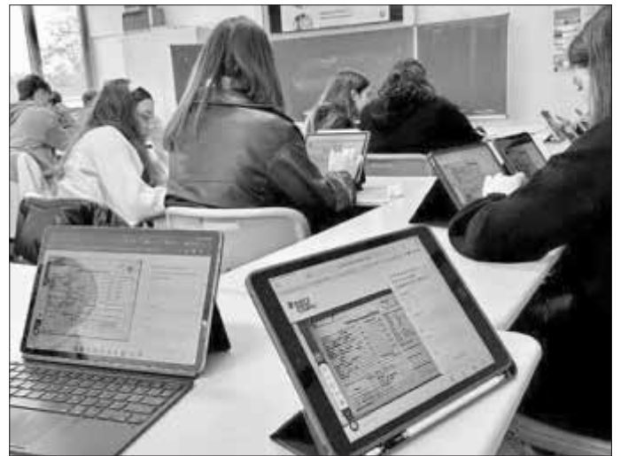
Unser Bild zeigt die Oberstufenkurse der Jahrgangsstufe Q1 bei der Arbeit mit der Website.

Bericht: Tim Scholz / Raoul Giebenhain, Presse- und Öffentlichkeitsarbeit