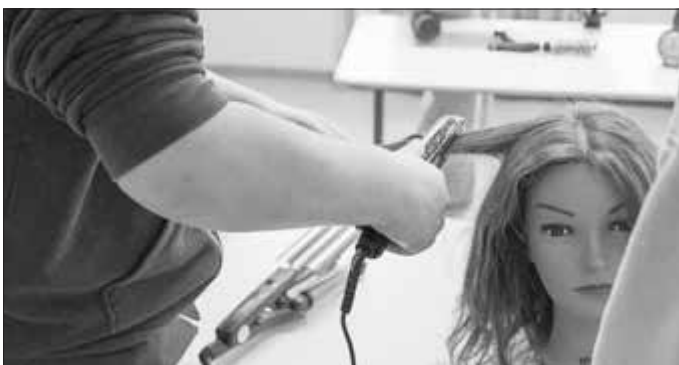
Unser Bild zeigt den Workshop „Friseur“ bei der „Olympiade der Berufe“ an der GAZ.

Bericht: Raoul Giebenhain, Presse- und Öffentlichkeitsarbeit