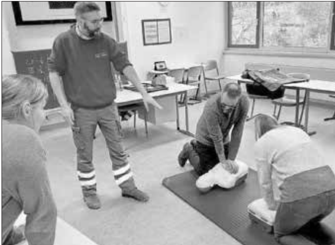
Unser Bild zeigt die Lehrkräfte der GAZ bei der Herz-Lungen-Wiederbelebungsschulung.

Bericht: Raoul Giebenhain, Presse- und Öffentlichkeitsarbeit