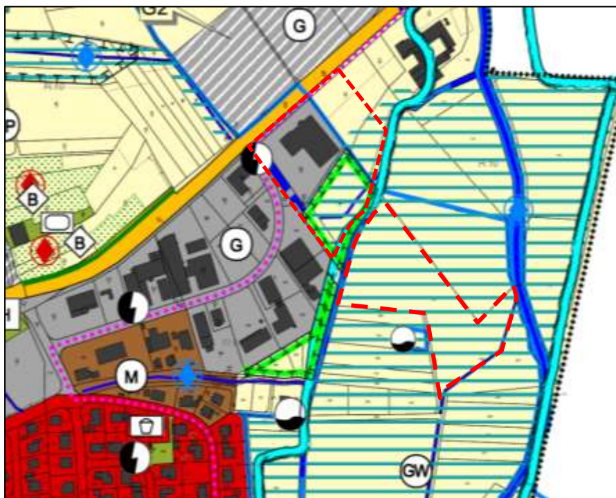
Auszug aus dem Flächennutzungsplan

Die derzeitige planungsrechtliche Situation des Flächennutzungsplanes wird im nachfolgenden Planauszug nochmals graphisch dargestellt.